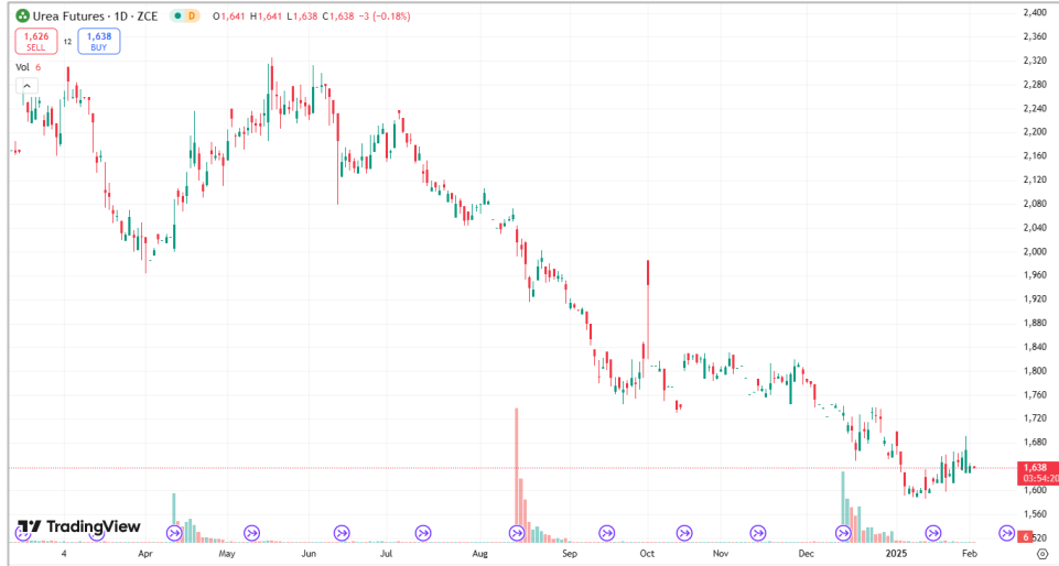
Giá Hợp đồng tương lai urê trên Sàn Giao dịch Hàng hóa Trịnh Châu (ZCE)