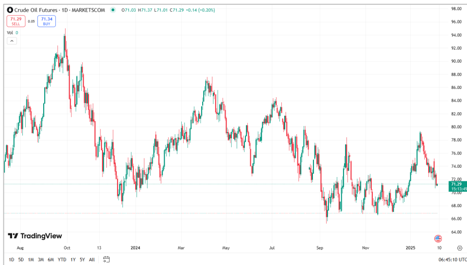
Diễn biến giá Hợp đồng tương lai dầu thô